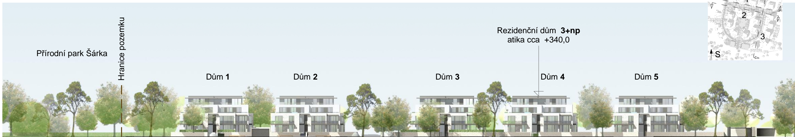
POHLED NA FASÁDY DOMŮ - 1